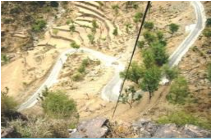
طريق الشايرة مغارب في بنبي شعيب - وصاب العالي - ذمار

فيما يخص المتابعة الميدانية لمشاريع القطاع، فقد تمت زيارة ١٨ مشروعاً فقط خلال الربع. ويرجع السبب في تدني هذا العدد إلى الظروف الراهنة التي تعيشها البلاد. وبذلك يكون عدد المشاريع الإجمالية التي تم زيارتها ١٨٤ مشروعاً.