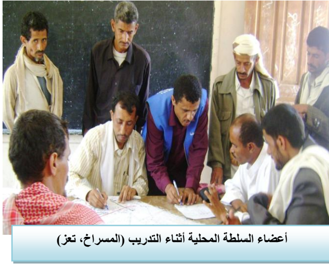
أعضاء السلطة المحلية أثناء التدريب (المسراخ، تعز)

تم تأهيل ٤٨ متدرباً و٥٣ متدربة من محافظة حضرموت، حيث استهدف التدريب تأهيل خريجين جامعيين لمانصرة قضايا التنمية في الريف (لعام ٢٠١١). وجاء استمرار هذا البرنامج استجابة من الصندوق لاستهداف فئة الشباب، وتأهيلهم، وخصوصاً في ظل الأوضاع الحالية.