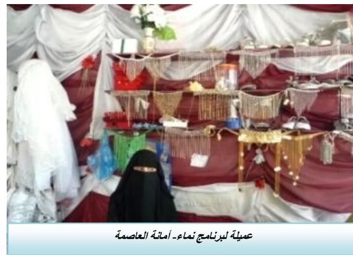
عملية لبرنامج نماء- أمانة العاصمة

متابعة لدراسة تقييم الاحتياجات الفنية التدريبية التي نفذتها عام ٢٠١٠، قامت الشبكة بتنفيذ دراسة تقييم الاحتياجات التدريبية والفنية للمؤسسات الأعضاء.. كما دشنت الحملة التعريفية بالتمويل الأصغر. وخلال هذه الفترة سعت الشبكة إلى زيادة الوعي بالتمويل الأصغر، والوصول إلى أكبر عدد من المستفيدين من خلال أنشطة تتمثل في عدد من الأدوات التسويقية كالإعلان في الصحف، والإعلانات التلفزيونية، والإذاعات المحلية، واللوحات الكبيرة، وتوزيع البروشورات، ونصب الخيام التعريفية بالتمويل الأصغر، وتوزيع مواد دعائية، وإقامة ورش عمل وندوات.