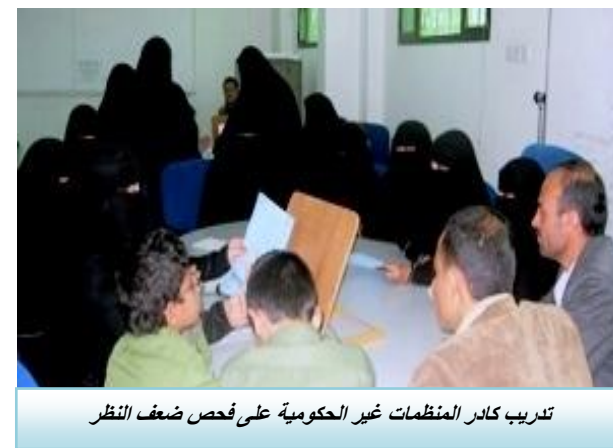
تدريب كادر المنظمات غير الحكومية على فحص ضعف النظر

وتم كذلك تنفيذ ١٠ دورات تدريبية لـ ٢٦٤ أخصائياً اجتماعياً ومعلماً للصفوف (٦-١) أساسي بمدارس مديرية حجة حول الوسائل البديلة للعقاب المدرسي. كما ذُرِب ٤٢ من الكادر التعليمي في ٧ مدارس بمحافظة لحج في نفس المجال.