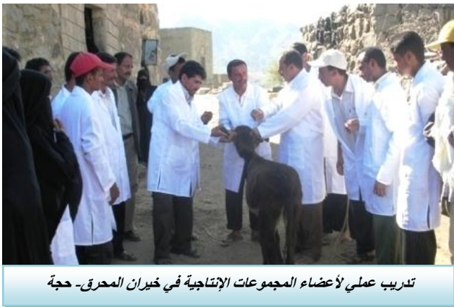
تدريب عملي لأعضاء المجموعات الإنتاجية في خيران المحرق- حجة

تم في فرع حجة عقد ورشة تدريبية لسبعة استشاريين لغرض تعريفهم بالمشاريع (بين المجتمعات)، وآلية تنفيذها، كما استمر بناء قدرات ومتابعة ٦٤ مجموعة منتجين /ات ريفيين في مديرية خيران المحرق و٨٤ مجموعة في المغربة (محافظة حجة). وتمت كذلك متابعة مساهمة لـ ٢٧ مجموعة في مجال النحالة وتربية الأمهات المحسنة وزراعة الأعلاف، فضلاً عن تنفيذ ثلاث مناقصات بالتعاقدات المجتمعية لإنشاء ٤ خزانات للري التكميلي. وَطُوِّرَتْ أيضاً مشاريع للدعم (بين المجتمعات) - مرحلة ثانية - في مديريات مستبأ وأسلم وبكيل المير لتمويل مجموعات متبقية من مشاريع سابقة.